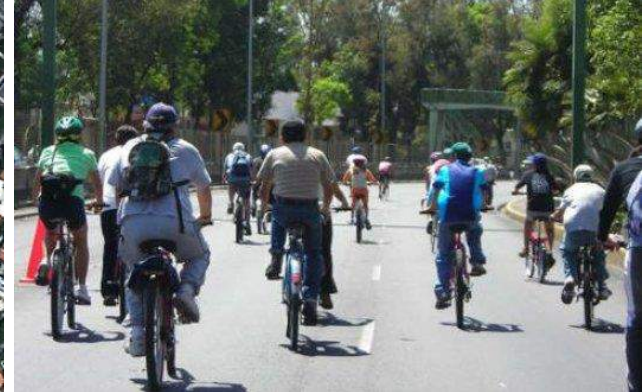
Multaj biciklantoj biciklas